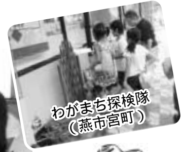
わがまち探検隊 (燕市宮町)