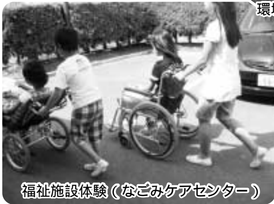
福祉施設体験(なごみケアセンター)