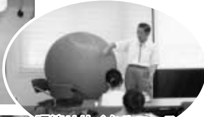
環境リサイクルコース

7月29日～8月26日の期間、高齢者・障がい理解・環境・災害分野9コースの体験スクールを開催しました。市内小学生とご家族の方、一般の方など延べ110名の方が参加体験されました。終了後の子どもたちからは、「初めて点字を打ってみて、難しかった」「お年寄りに似顔絵を描いてあげたら、すごく喜んでいた」などたくさんの感想が寄せられました。福祉への関心やボランティア活動への第一歩として、今後もいろいろなことにチャレンジしてみましよう!