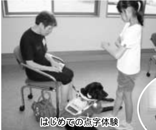
はじめての点字体験

7月29日～8月26日の期間、高齢者・障がい理解・環境・災害分野9コースの体験スクールを開催しました。市内小学生とご家族の方、一般の方など延べ110名の方が参加体験されました。終了後の子どもたちからは、「初めて点字を打ってみて、難しかった」「お年寄りに似顔絵を描いてあげたら、すごく喜んでいた」などたくさんの感想が寄せられました。福祉への関心やボランティア活動への第一歩として、今後もいろいろなことにチャレンジしてみましよう!