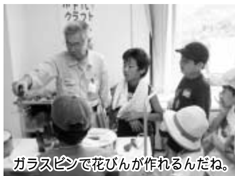
ガラスピンで花びんが作れるんだね。

ボランティアスクール開催に、ご支援・ご協力いただいた福祉施設、ボランティア団体、関係機関に感謝申し上げます。