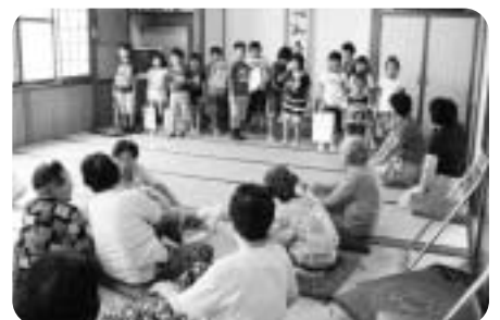
世代間交流も行われています 「ふれあいいいききサロン」