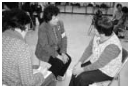
相手の話を聴くことの大切さを学びます 「傾聴ボランティア養成講座」