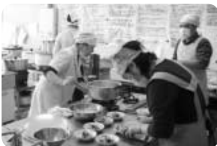
就労支援センター 「お届け昼ごはん」