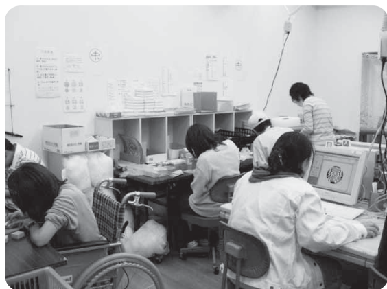
依頼された仕事を、正確に丁寧に行います ～就労支援センター～