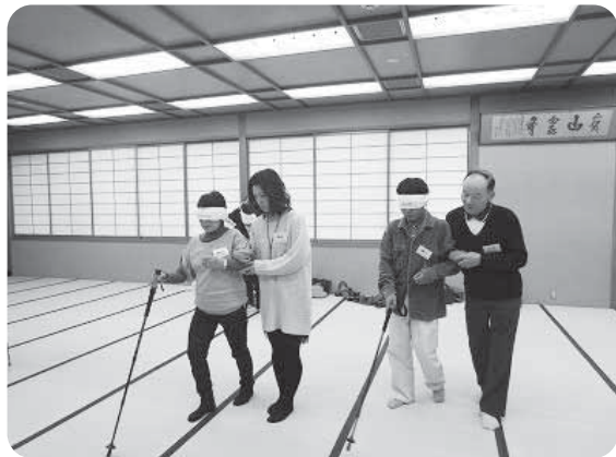
支え合い活動のきっかけに ～「地域たすけ隊」ボランティア講座～