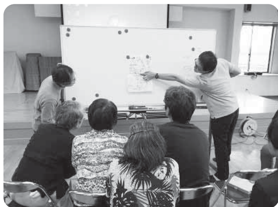
地域の状況をマップづくりで見つめます ～「支え合いマップ」づくり～