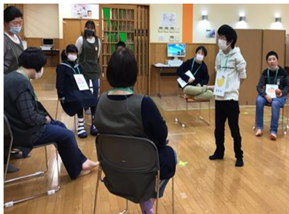
小集団活動「フルーツバスケット」