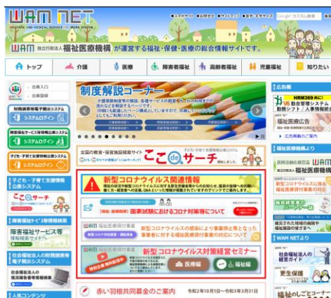
【WAMNET で情報公表しています】