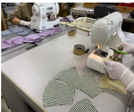
【A型：新たに取り組んでいる布マスク製作】