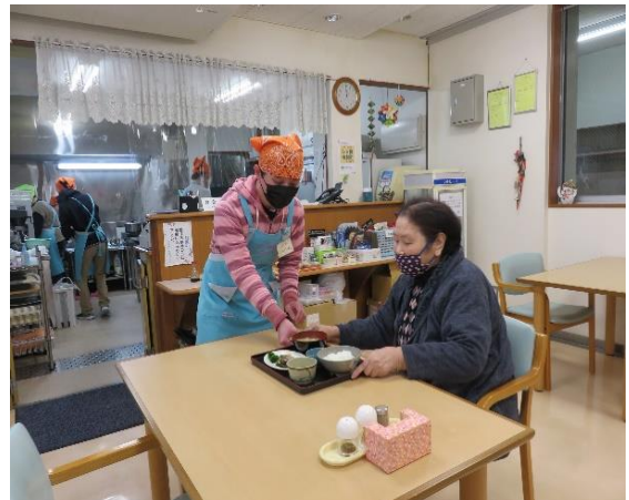
【ふれあい喫茶ほぼ】