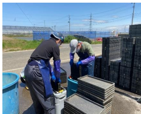
【B型：農家での苗箱洗浄作業】