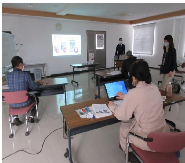
【ボランティア活動者向け zoom 活用講座（初級編）】