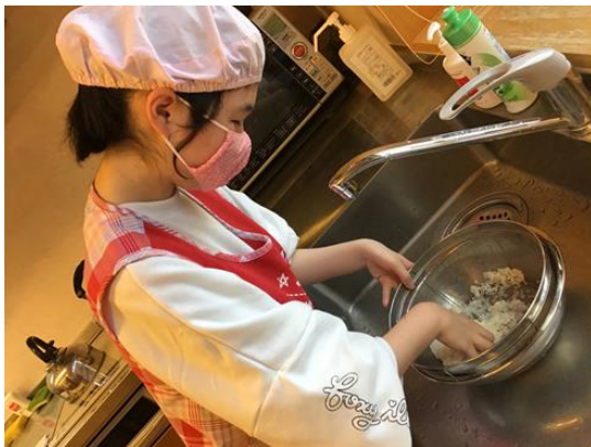
生活訓練「お米を研いでおにぎりをつくろう」

【日々の活動や毎月の行事で 社会生活の経験の場を広げたり 季節の変化を感じたり 一つひとつできるよう支援します】