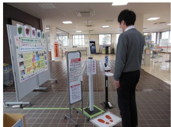
【市民交流センターでは検温を徹底しています】