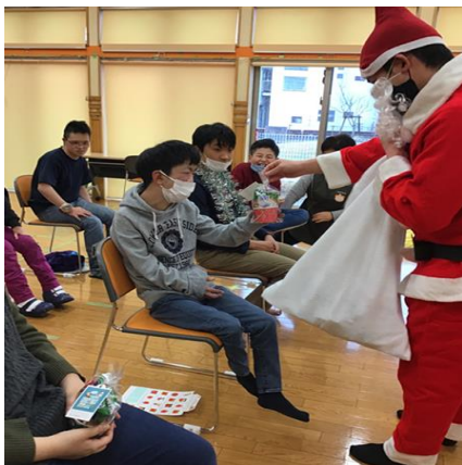
季節の行事「クリスマス会」