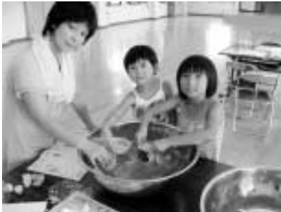
使用済みろうそくを再利用した、カラフルな自分だけのキャンドルづくり

参加した子ども達は、施設の利用者さんとのふれあいを通して、人を思いやる心の大切さを学びました。