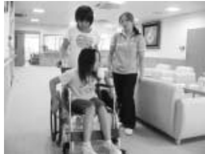
お年寄りの気持ちになって車イスの体験をしました。