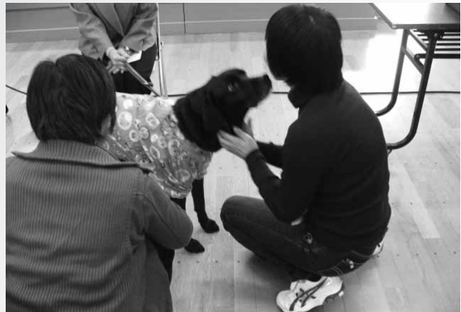
～障がい理解講座より～

盲導犬と初めて触れ合う事ができ新鮮な気持ちになった。障がいを持った方の生活を知る事で、自分にできる事を探すキッカケにつながった。