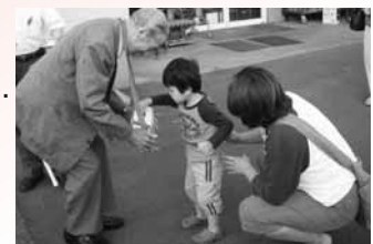
～街頭募金～ ご協力ありがとうございました