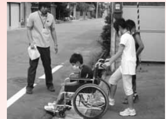
～福祉教育～ 車イスを体験

ボランティア活動 障がいを持つ人への支援 学校や地域での福祉教育 地域での見守り活動 高齢者の生きがいづくり など