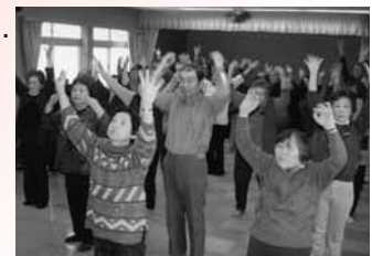
～ふれあいサロン～ 生きがい・仲間づくり

ひとり暮らしの高齢者などへ おせち料理の宅配 高齢者の除雪・障子張替の支援 地域のサロン開催 など