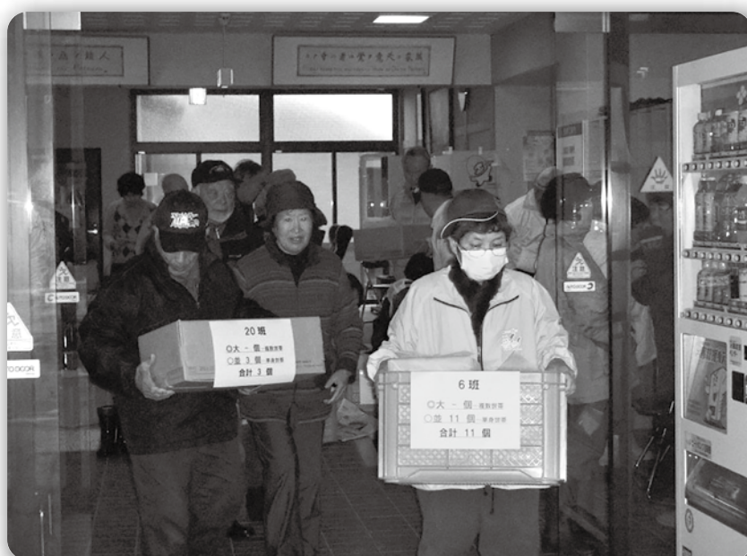
75歳以上の単身高齢者等におせち料理をお届け