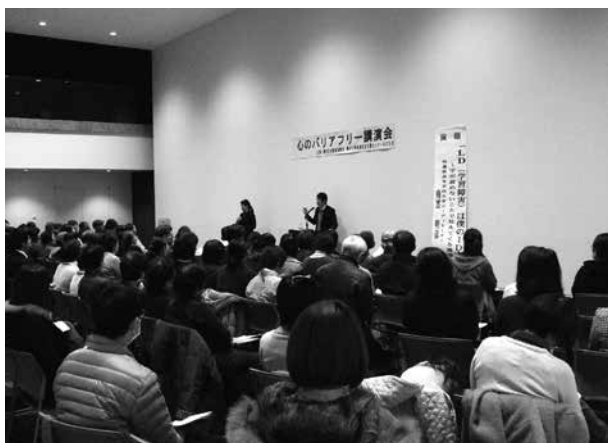
熱心に聞き入るご来場者