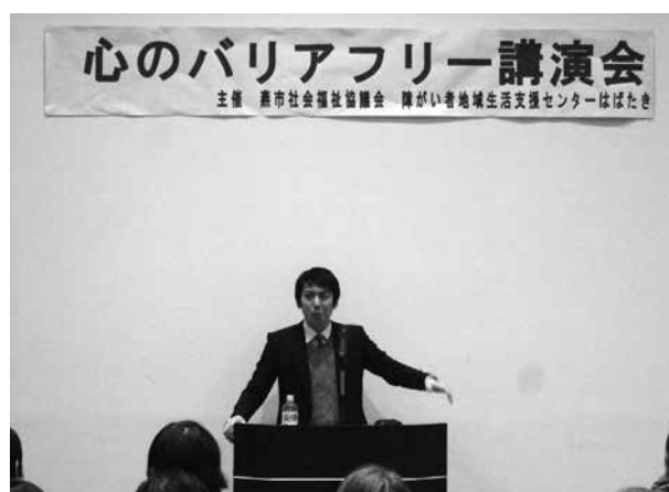
ユーモアたっぷりの熱い語り