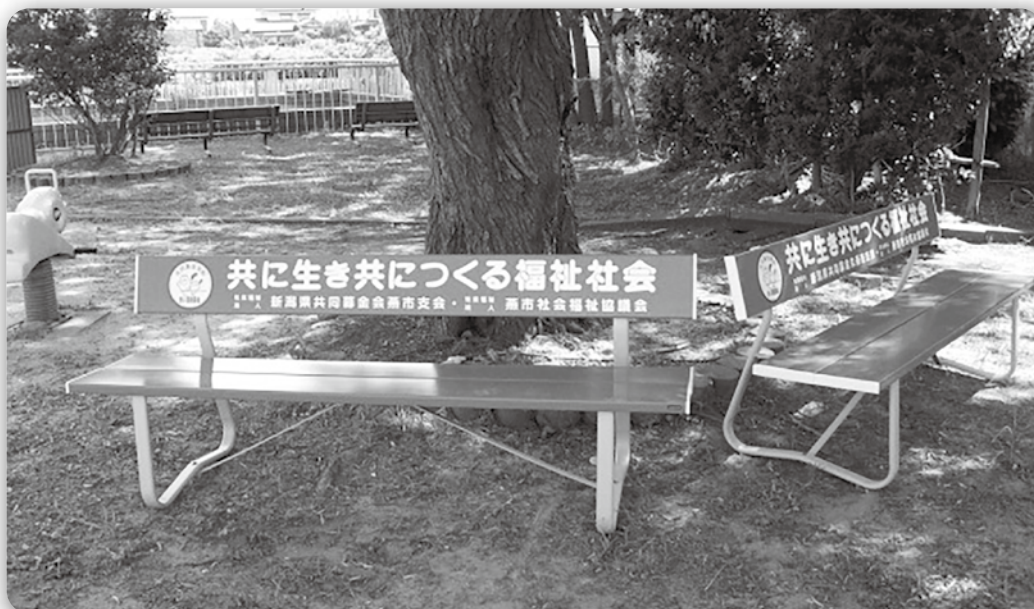
市内の公園に ベンチを設置