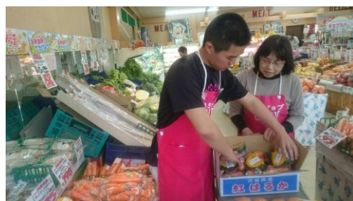
職業体験活動の様子

「地域のために何かしたい」「今の活動をより充実させたい」と考えている団体の皆さんへ