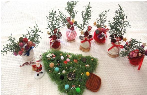
(2)-③地域活動支援センター 【アロマ講座（作品づくり）】

※上記の各事業における事故、ヒヤリハット及び苦情は、関係者への適切な対応によりすべて解決しました。