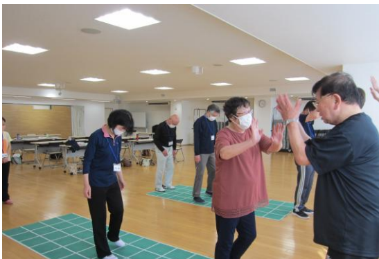
(3)-⑤地域介護予防活動支援事業/介護予防普及啓発事業 【スクエアステップ】