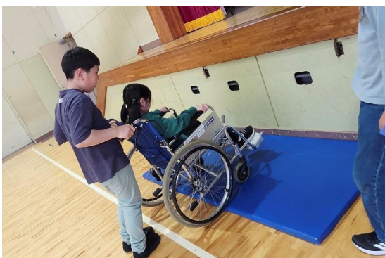
(3)-②福祉教育・総合学習の支援 【福祉体験教室】