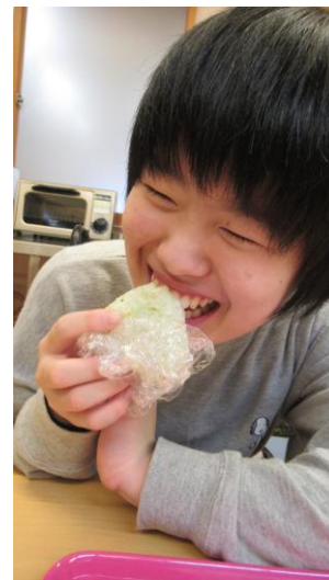
(2)-⑤放課後等デイサービス事業所はばたき 【おにぎりを作ろう（クッキング体験）】